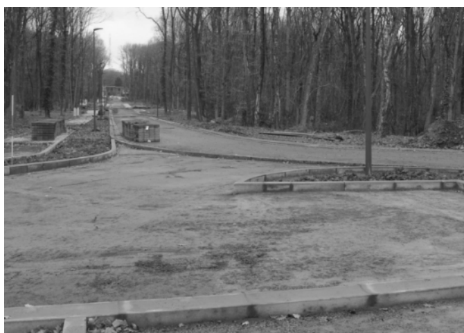
Pré Aily : vue de la petite placette vers rue du Sart-Tilman.