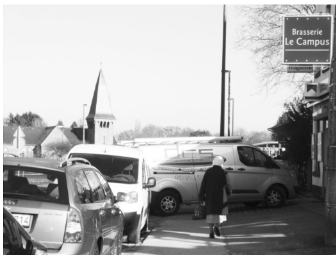
Exemple de stationnement interdit et entravant les piétons.