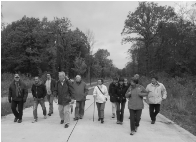
Au pas, camarades ! Au pas, au pas , au pas!