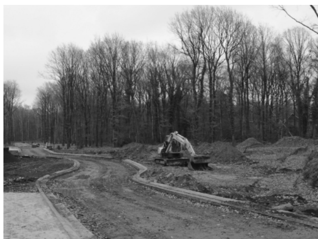
Pré Aily : grande placette, à droite, ébauche du chemin vers rue des Bouleaux.

Éditeur responsable : S. Dozin, rue des Bouleaux à 4031 LIEGE.