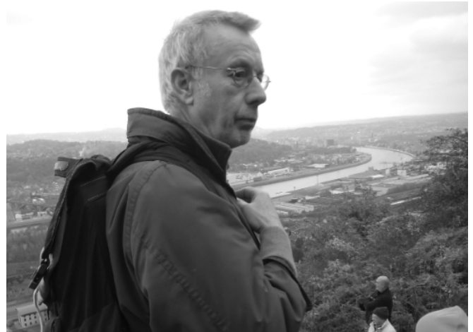
Le guide devant le panorama sur la vallée de la Meuse