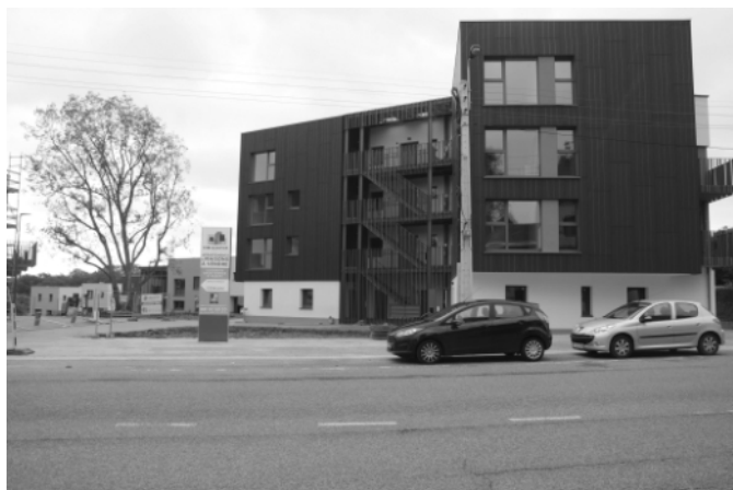
Éco-quartier : bâtiments actuellement occupés.