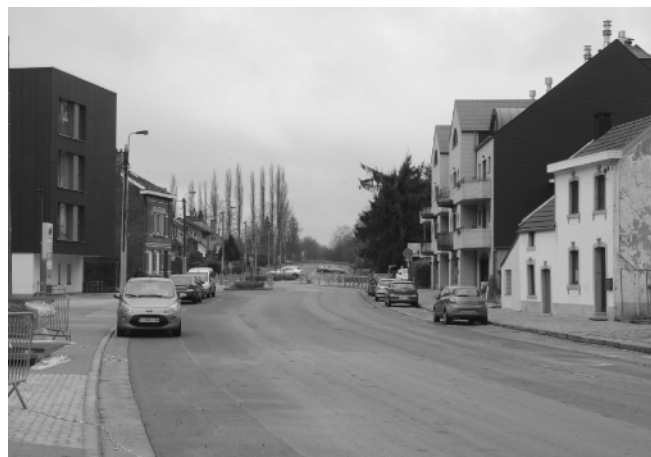
Éco-quartier : contraste entre l'ancien et le nouveau bâti.