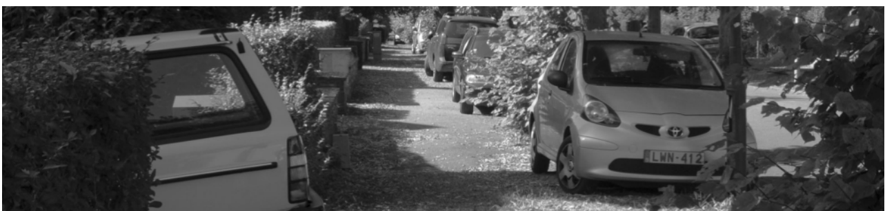
Exemple de stationnement correct sur l'accotement.