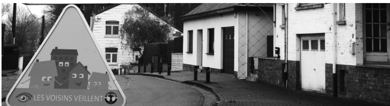
Panneau annonçant « LES VOISINS VEILLENT » à l'entrée de la zone PLP.

activement à la bonne mise en œuvre du PLP, plus d'une centaine de familles collaborent entre elles et avec les autorités pour que le quartier Belle-Jardinière soit un lieu sûr où il fait bon vivre et, selon une enquête de satisfaction des riverains, le résultat semble atteint : le sentiment d'insécurité est en baisse. Quant aux résultats à proprement parler, avant et après PLP, ils sont très encourageants : « Le nombre de vols qualifiés passe de 31 à 19 et les tentatives de vols de 19 à 5 ». La police est informée en temps réel du moindre incident et ces données, recoupées entre elles, permettent de garantir la sécurité du quartier. Selon Monsieur Liquet, le PLP a également d'autres avantages : les membres, communiquant régulièrement entre eux, ont appris à se connaître et se côtoient de plus en plus. Les habitants du quartier sont devenus une véritable équipe qui fonctionne ensemble ! Il conclut : « Le bon fonctionnement vient d'un travail d'équipe. Tout seul, on va plus vite, mais ensemble, on va plus loin ! »