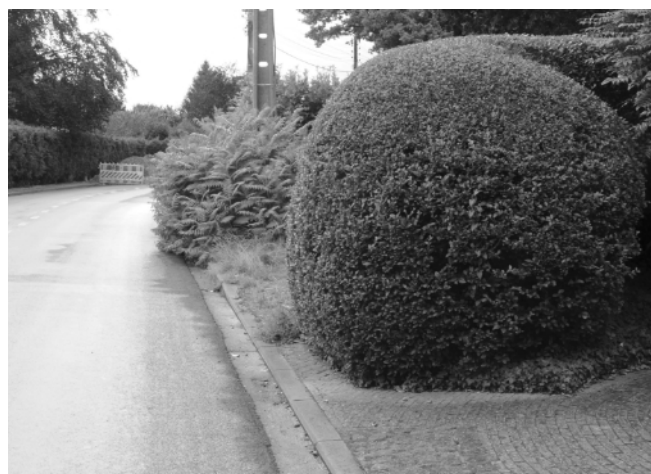
Exemple de végétation entravant le passage sur le trottoir.